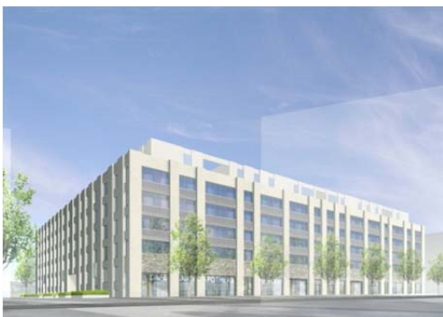
Favrehof: 118 Mietwohnungen sowie Gewerbeflächen im Erdgeschoss

Mit den Arbeiten auf dem letzten noch unbebauten Baufeld auf dem Richti-Areal hat Allreal Anfang März begonnen. Nach Abschluss der Vorbereitungsarbeiten wurde mit dem Aushub für das Wohngebäude Favrehof mit 118 2½- bis 5½-Zimmer-Mietwohnungen sowie Gewerbeflächen im Erdgeschoss und einer Tiefgarage mit 116 Parkplätzen gestartet. Die Architekten Diener & Diener haben das sechsgeschossige Gebäude entworfen. Die Bauarbeiten für den Favrehof dauern voraussichtlich bis Sommer 2014. Die Vermietung der Wohnungen startet frühestens ein Jahr vor Fertigstellung.